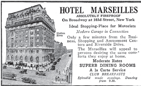
Илл. 3. Гостиница «Марсель»