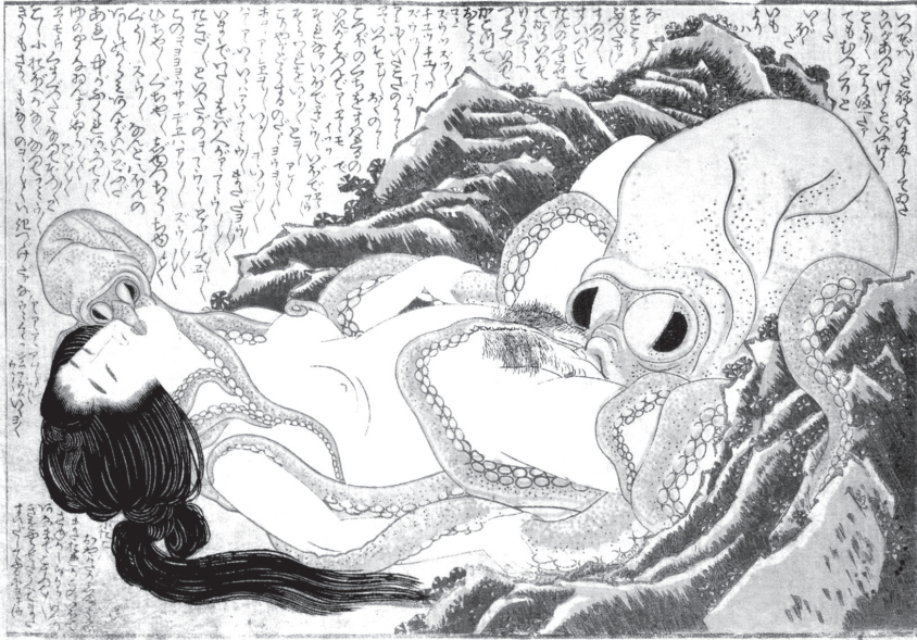
Илл. 1. Хокусай «Сон жены рыбака» (1814)

русско-японской войны высказывал отталкивающе имперские и милитаристские взгляды) (см.: Молодяков 1996; Дьяконова 2017: 283–289, Тырышкина 2019: 378–394). Представляется, что именно Хокусай и вдохновил «Нелли» на обсуждаемую антиэстетическую метафору.