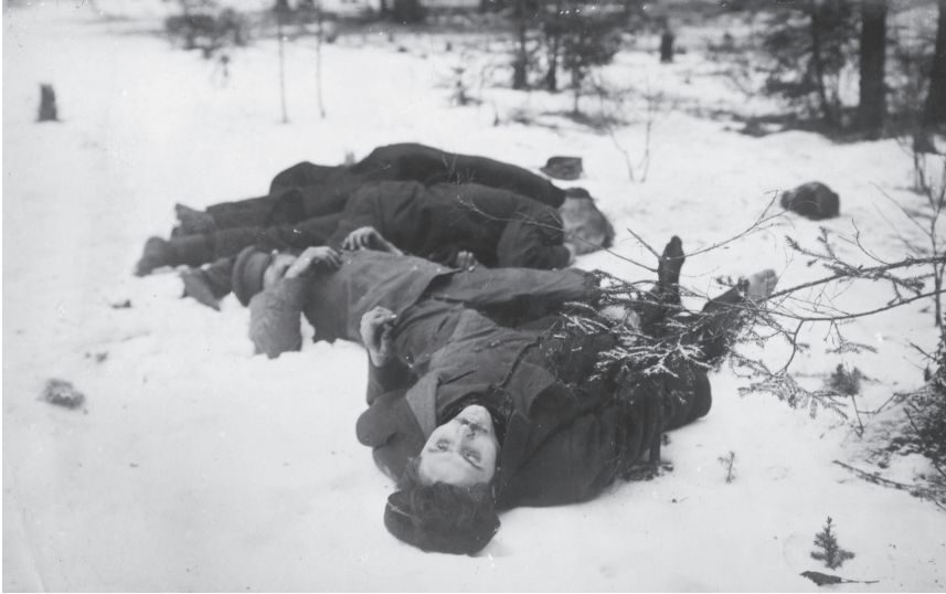
Tapetud punakaartlased Tapa raudteejaama lähedal. 10. jaanuar 1919.