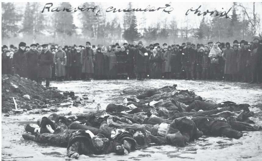
Punase terrori ohvrid Palermo metsas Rakvere lähedal pärast surnukehade ekshumeerimist. 17. jaanuar 1919.