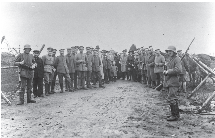
Saksa sõdurid Narvas koos kohalike elanikega (1918).