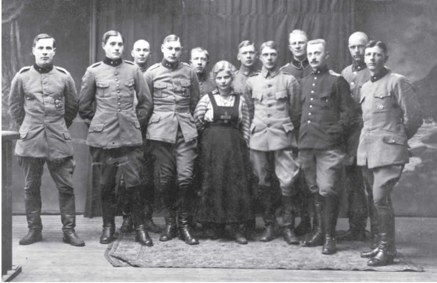
Rühm Rootsi vabatahtlikke Eestis, 1919. KLM FT 1018:5 F

Kongo Vaba Riik sai sel määral rõhumise ja inimeste väärkohtlemise musternäiteks, et 1908. aastal muutis Belgia valitsus selle kolooniaks ja kehtestas seal riiklikku kontrolli. Sõjaväelased, kes olid Kongos teeninud ja ellu jäänud, olid karastunud ja kogenud professionaalid. 13