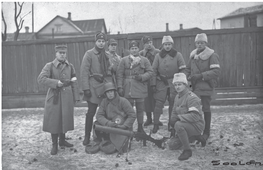
Rootsi vabatahtlikud Narvas 1919. aastal.