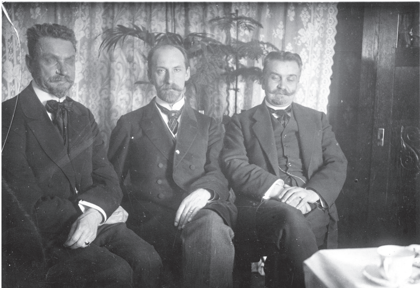
Eesti välisdelegatsiooni liikmed Kopenhaagenis 1918. aastal. Paremt: Karl Menning, Jaan Tõnisson ja Mihkel Martna.

1918. aasta oktoobris ja novembris tegi Tõnisson mitu katset veenda Rootsi valitsust Eestis sõjalise sekkumise vajaduses. Samasuguseid soovitusi tuli ka Ameerika Ühendriikidest ja Suurbritanniast. „Aktivistide“ leeriga ühines isegi endine Venemaa ajutine valitsus oma välisministri Mihhail Tereštšenko näol.